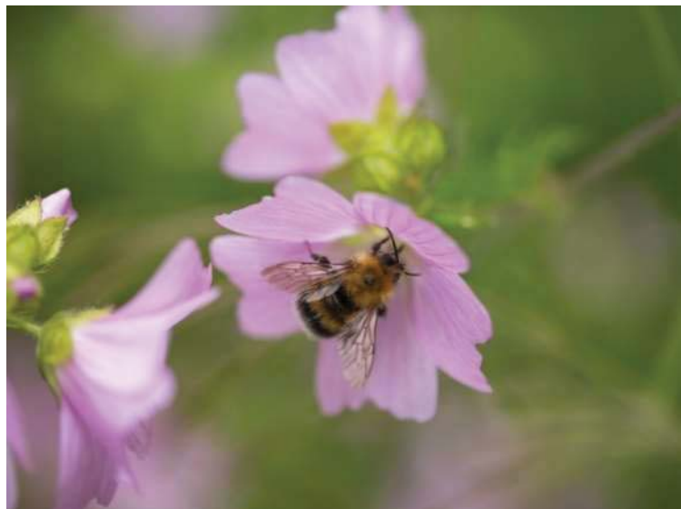
Wildbiene auf Malve

Im Gegensatz zu Honigbienen sind Wildbienen z.T. stark auf einzelne Pflanzen spezialisiert. Die bevorzugten Nahrungspflanzen sind auf die Rüssellänge abgestimmt